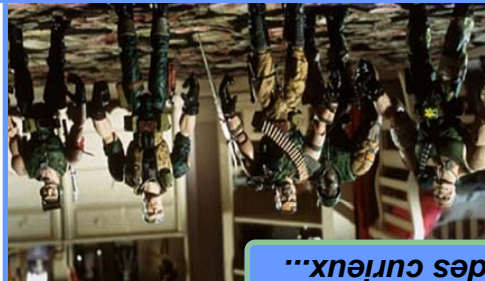
Le coin des curieux...

Le grand challenge de Small Soldiers est l'animation millimétrée des personnages. Aux manettes, Stan Winston, un des meilleurs spécialistes d'Hollywood dans ce domaine ( Terminator, Edward aux mains d'argent, A.I. ). Plusieurs versions ont été réalisées : l'une est inerte, et simplement destinée aux cascades (explosions, chutes, etc.), l'autre est manipulée manuellement, à l'aide de baguettes qui sont ensuite effacées digitalement, et la dernière est une « animatronique », activée par câbles, mécanismes internes ou commande à distance. L'essentiel des plans sera ensuite traité par les ordinateurs d'I.L.M., qui renforceront les expressions des visages et ajouteront des effets de mouvement plus complexes, géant également les interactions avec l'environnement réel.